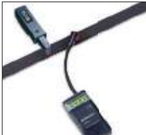
VSM-1 & VSM-3 Vorspannungsmessgeräte optische, höchstpräzise Messung, für alle Riementypen geeignet

VSM-1 & VSM-3 pretension gauges Optical, high-precision measurement, suitable for all belt types