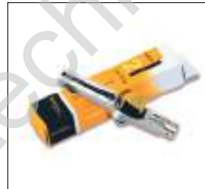
Keilrippenriemen- vorspannungsmessgerät KRIKIT Optimale Einstellung von Keilrippen- riemen bis zu seiner Zugspannung von 70 kg

VSM-1 & VSM-3 pretension gauges Optical, high-precision measurement, suitable for all belt types