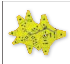
Keilriemen Scheibenlehre Bestimmt das Scheibenprofil und die Flankenabnutzung einer Keil- riemenscheibe

VSM Mini pretension gauge Compact electronic gauge with best price-performance ratio