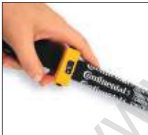
VSM Mini Vorspannungsmessgerät Kompaktes elektronisches Messgerät mit bestem Preis-Leistungs-Verhältnis

KRIKIT multiple V-ribbed belt pretension gauge Optimal adjustment of multiple V-ribbed belts to tensile stress of 70 kg